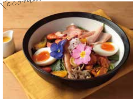
シェフズサラダ 1480 The Chef's Salad 季節野菜のお惣菜やグリルした海老、 燻製卵など色々のってボリューム満点。 おつまみとしても最高♪