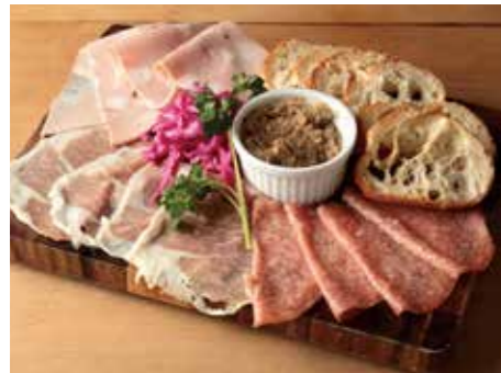
シャルキュトリープレート 1480 Charcuterie Plate 生ハム・サラミ・豚肉のリエットなど お肉屋さんのお惣菜を盛り合わせに！

TO SHARE 2名様以上でシェアして楽しい！ 大勢でワイワイお酒のつまみにも おすすめ。